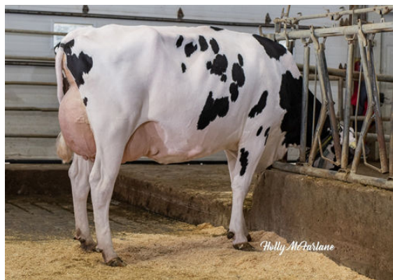
PROGENESIS JEDI MENACE GRANDDAM