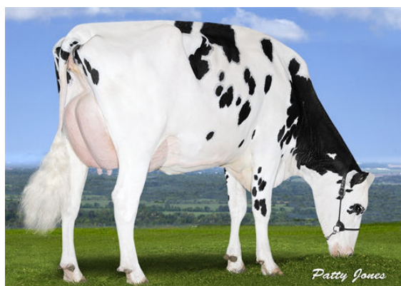
PEAK BOMBERO MAXIMA THIRD DAM